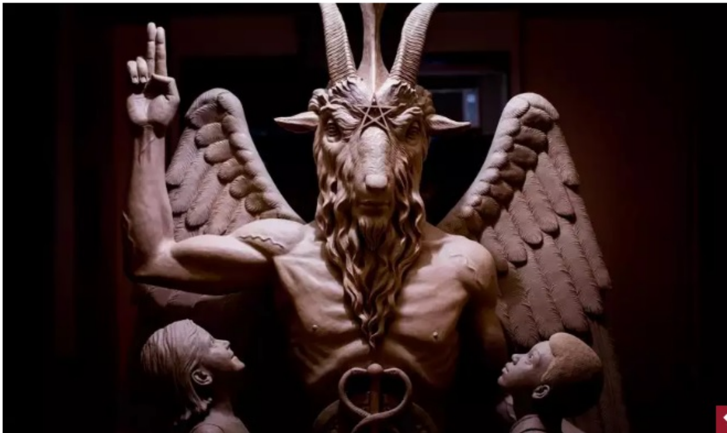
This 2014 photo provided by The Satanic Temple shows a bronze Baphomet, which depicts Satan as a goat-headed figure surrounded by two children. (The Satanic Temple via AP) ** FILE ** more >

A city council meeting in Pensacola, Florida, turned chaotic Thursday evening when officials allowed a local religious-freedom activist to start the event with a Satanic prayer.