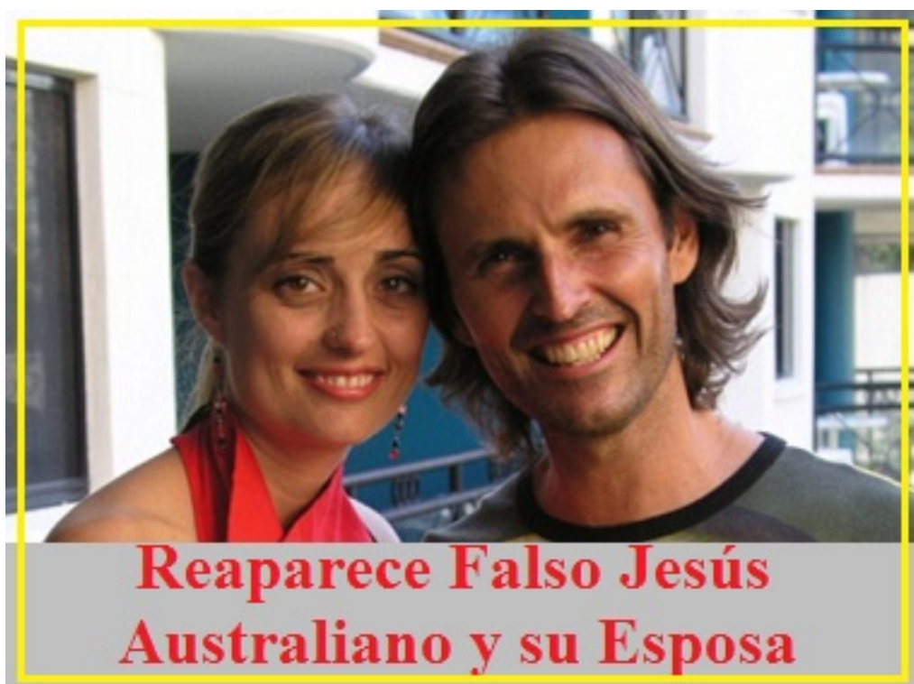
Reaparece Falsos Jesús Australiano. La Tribulación es inminente.